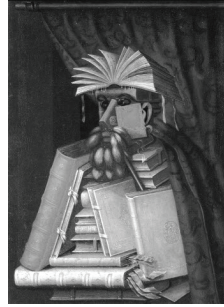
Der Bibliothekar, Giuseppe Arcimboldo (1526–1593)

Bücher abholen und sortieren, am Bazar auslegen, die Leserinnen und Leser beglücken, die Schule finanziell unterstützen, ein Kulturgut bewahren. Das bedeutet viel Freude und Genugtuung für die Antiquarin, aber auch viel, manchmal zu viel Arbeit. Kurz gesagt, sie braucht Mithilfe.